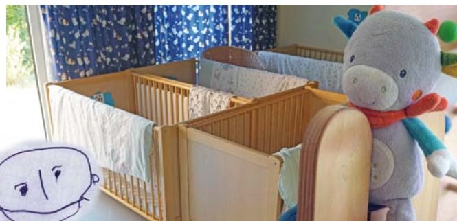
Unser liebevoller Schlafbereich gibt Raum für Ruhe und Erholung