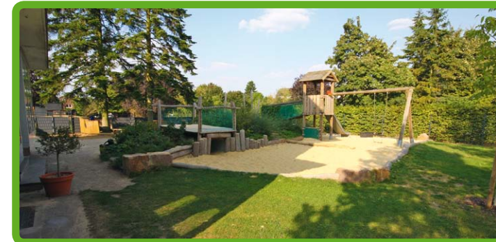
Viele Spielmöglichkeiten in unserem kindgerechten Garten