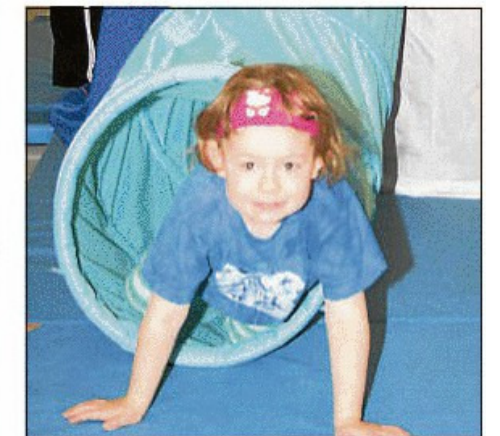
Spaß in der Tunnelrutsche hatten die Mädchen und Jungen.