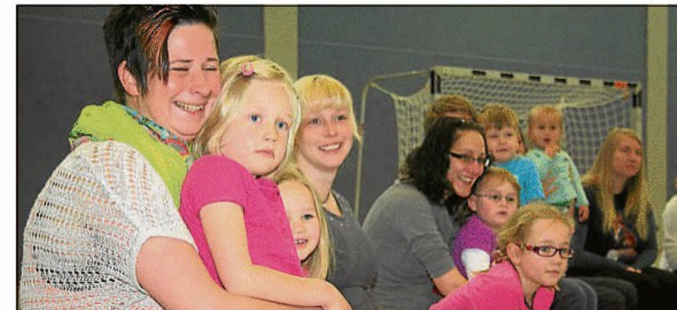
Zu einem Familien-Sportfest hatte die Alexe-Hegemann-Kita in die Axtbachhalle geladen.